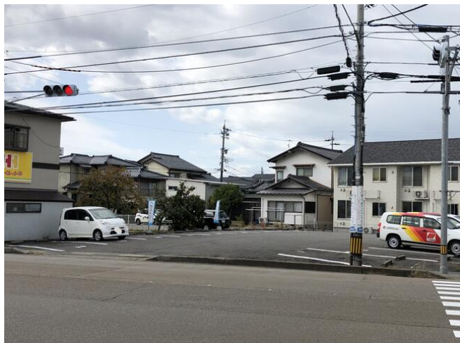
直江町 林月極駐車場Ⅱ